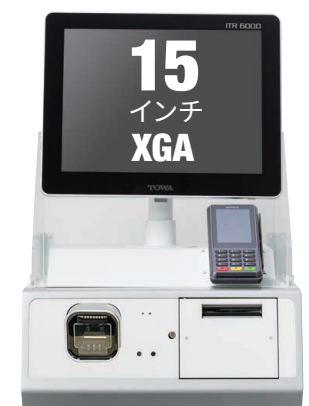
CHS-15 白 黒あり