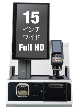
CHS-15W 黒 白あり