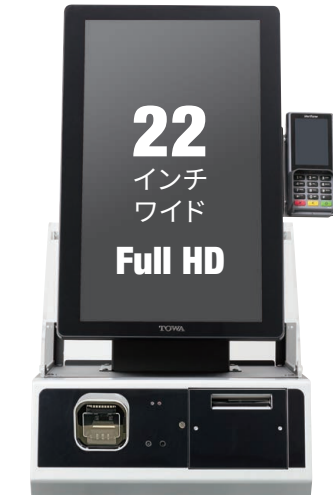
CHS-22W 黒 白あり