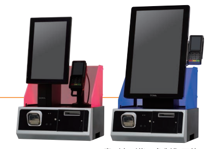
青/赤/紫 3色制御可能

対応端末 Verifone製：p400 ルミーズ製：sal0-01 (15インチワイドモデルのみ対応)