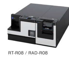
RT-R08 / RAD-R08