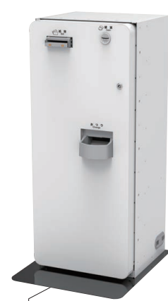
CBPM01-1 一枚挿入排出 白 あり