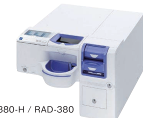
RT-380-H / RAD-380

POS・レジスターとの連動で実績のあるつり銭機タイプ。専用の木製キャビネットに収納してお使いいただけます。