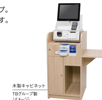
木製キャビネット TBグループ製 (イメージ)