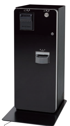
CBPM01-2 一枚挿入排出 黒 あり

メインユニットと連結してキャビネットなしでお使いいただけます。紙幣の一括挿入排出タイプと一枚ごと挿入排出タイプがあります。