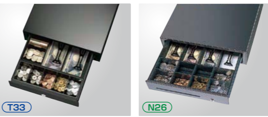
スタンダードドロア 約5.2kg 幅350mm×奥行405mm×高さ104mm デラックスドロア 約6.7kg 幅410mm×奥行415mm×高さ114mm

2種類のセパレート式ドロアを用意しております。レジ台のスペースや使い勝手に合わせて選択できます。