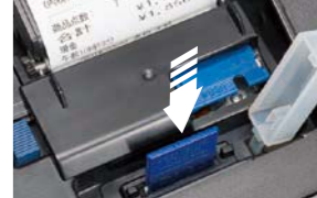
※SDカードはオプションです。※SDカードは登録商標です。

SDカード対応により、設定・売上データの保存や店名ロゴデータなどのダウンロードが可能です。