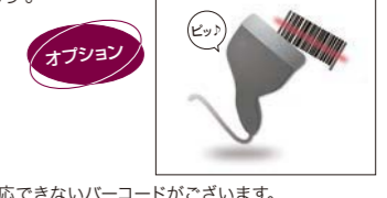
※対応できないバーコードがございます。

バーコードスキャナ接続でさらに便利に。簡単かつスピーディーな会計処理が可能となります。自動学習機能により未登録商品でも営業中にバーコードを使用し、新規商品の簡易登録が行えます。業務の効率化に貢献します。