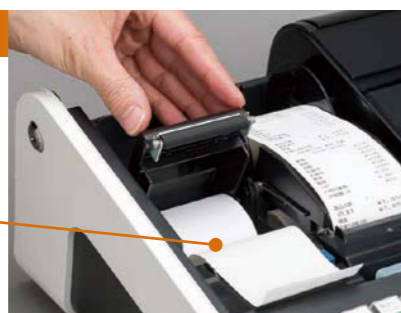
※オートカッターではありません。