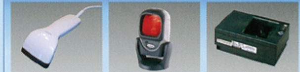
ハンドスキャナ ミニ固定スキャナ(脱着式) 固定スキャナ ※ハンドスキャナとしてもご使用できます。