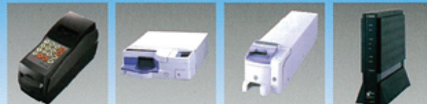
ポイントカードシステム PP-5B 磁気的読機 紙的読機 ルーター